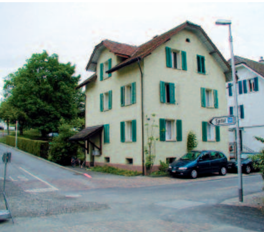
Aussenansicht der Liegenschaft Rigistrasse 7

schen und sanitären Installationen sind aber nicht mehr zeitgemäss, und die Wohnungen und die Gebäudehülle sind sanierungsbedürftig. Aus diesem Grund möchte der Bürgerrat dieses Gebäude sanieren oder durch einen Neubau ersetzen. Als Nutzung streben wir ein Konzept mit Büros und Praxisräumen und einem Anteil an Wohnungen an.